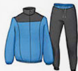
η φόρμα (αθλητική)