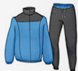
η φόρμα (αθλητική)